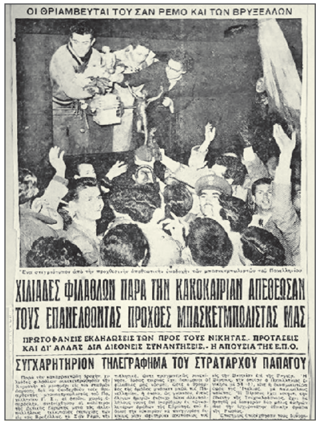
Δημοσίευμα για την υποδοχή της «χρυσής πεντάδας» στον Σιδηροδρομικό Σταθμό Αθηνών μετά τους θριάμβους σε Βρυξέλλες και Σαν Ρέμο