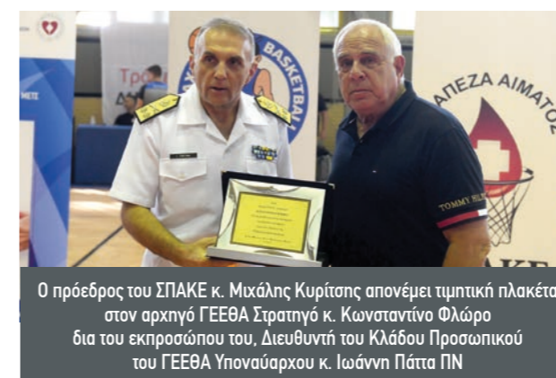
Ο πρόεδρος του ΣΠΑΚΕ κ. Μιχάλης Κυρίτσας απονέμει τιμητική πλακέτα στον αρχηγό ΓΕΕΘΑ Στρατηγό κ. Κωνσταντίνο Φλώρο δια του εκπροσώπου του, Διευθυντή του Κλάδου Προσωπικού του ΓΕΕΘΑ Υποναύαρχου κ. Ιωάννη Πάττα ΠΝ