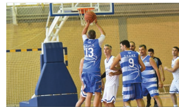
«Βάλτο αγόρι μου» από τον Δημήτρη Διαμαντίδη στον αγώνα επίδειξης!

Με μεγάλη επιτυχία πραγματοποιήθηκε στο κλειστό γήπεδο «Παναγιώτης Γκάτζγκας» (γήπεδο ΜΕΤΣ) στο Παγκράτι εθελοντική αιμοδοσία, που διοργανώθηκε υπό την αιγίδα του ΓΕΕΘΑ και του Συλλόγου Παλαίμαχων Αθλητών Καλαθοσφαίρισης Ελλάδος (ΣΠΑΚΕ), με την υποστήριξη του Δήμου Αθηναίων και του Ελληνικού Ιδρύματος Καρδιολογίας (ΕΛ.Ι.ΚΑΡ.), στο πλαίσιο του κοινωνικού ρόλου των Ενόπλων Δυνάμεων. Η δράση ήταν αφιερωμένη στην μνήμη των αλεξιπτωτιστών Θεόδωρου Παντελάκη, Κωνσταντίνου Μελιγκώνη και Παναγιώτη Συριανού που έπεσαν εν ώρα καθήκοντος, καθώς και στα 30 χρόνια μνήμης του αλεξιπτωτιστή Δημήτρη Βλών. Όσες και όσοι βρέθηκαν στο κλειστό γήπεδο του Μετς παρακολούθησαν αγώνες επίδειξης μεταξύ των ομάδων ανδρών και γυναικών της Εθνικής Ενόπλων του Ανώτατου Συμβουλίου Αθλητισμού Ενόπλων Δυνάμεων (ΑΣΑΕΔ) του ΓΕΕΘΑ, με τις αντίστοιχες ομάδες ανδρών και γυναικών του ΣΠΑΚΕ, ενώ παράλληλα είχαν την ευκαιρία να ενημερωθούν για θέματα υγείας και ιατρικών εξελίξεων με τις γνώσεις και τις εμπειρίες της Ελληνικής Καρδιολογικής Εταιρίας. Μεταξύ των αθλητών που αγωνίστηκαν με τον ΣΠΑΚΕ ήταν οι Πρωταθλητές Ευρώπης Δημήτρης Διαμαντίδης, Βαγγέλης Βουρτζούμης, Γιάννης Σιούτης, οι Άκης Καλλιδικίδης, Τάσος Κανταρτζής κ.α.