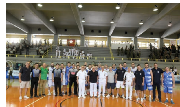
Η Εθνική Ενόπλων και η Ομάδα Επιλέκτων του ΣΠΑΚΕ