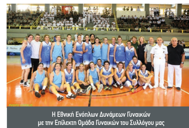
Η Εθνική Ενόπλων Δυνάμεων Γυναικών με την Επίλεκτη Ομάδα Γυναικών του Συλλόγου μας