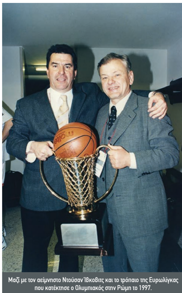
Μαζί με τον αείμνηστο Ντούσαν Ίβκοβιτς και το τρόπαιο της Ευρωλίγκας που κατέκτησε ο Ολυμπιακός στην Ρώμη το 1997.

Όταν ήρθε, λοιπόν, ο Ντουκσάιρ έγινε... επανάσταση. Βέβαια τότε τον αποκαλούσαν Ζωγράφου, γιατί έγραφε στο πινακάκι, που σήμερα, το 2024 το κάνουν όλοι».