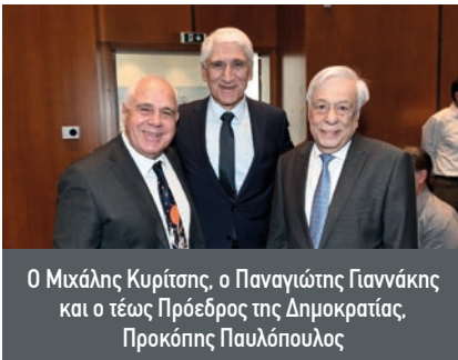
Ο Μιχάλης Κυρίτσος, ο Παναγιώτης Γιαννάκης και ο τέως Πρόεδρος της Δημοκρατίας, Προκόπης Παυλόπουλος