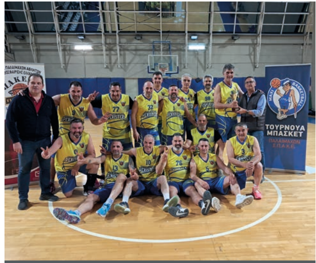
Το Περιτέρι, η νικητρία ομάδα του 5ου Τουρνουά ΣΠΑΚΕ!

ΠΑΝΑΘΗΝΑΪΚΟΣ: Καλογερόπουλος 10 (2), Μπουρμπούλης 6 (2), Ηλιάδης Αγγ., 6, Γεωργικόπουλος 17 (3), Παπαδόπουλος, Κουτουζής 21 (3), Ηλιάδης Χρ., Αντύπας 10.