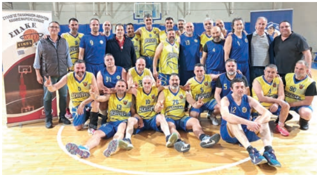
Οι δύο αντίπαλοι του τελικού αγκαλιασμένοι, οι ομάδες του Περιστερίου και των Καλυβίων

ΒΑΡΗ: Μαρκόπουλος 16 (2), Νικολόπουλος 11, Τελκούδης 6, Καραβάκης 12 (2), Αγαλιώτης, Νοβάρια, Ζάγκας 15 (4).