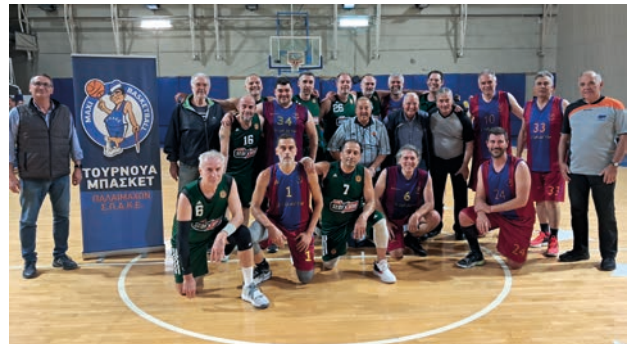
Ο Παναθηναϊκός και η Βάρη οι δύο ομάδες που έπαιξαν στον μικρό τελικό