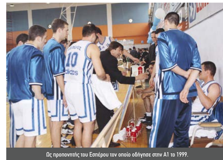
Ως προπονητής του Εσπέρου τον οποίο οδήγησε στην Α1 το 1999.

«Οι σύγχρονοι παίκτες έχουν καλύτερη σωματοδομή από εμάς, αν και εμείς δεν κάναμε λιγότερη προπόνηση», σχολιάζει επίσης. «Στο σύγχρονο μπάσκετ, το βάρος έχει πέσει στην δύναμη και την ταχύτητα, ενώ στην δική μας