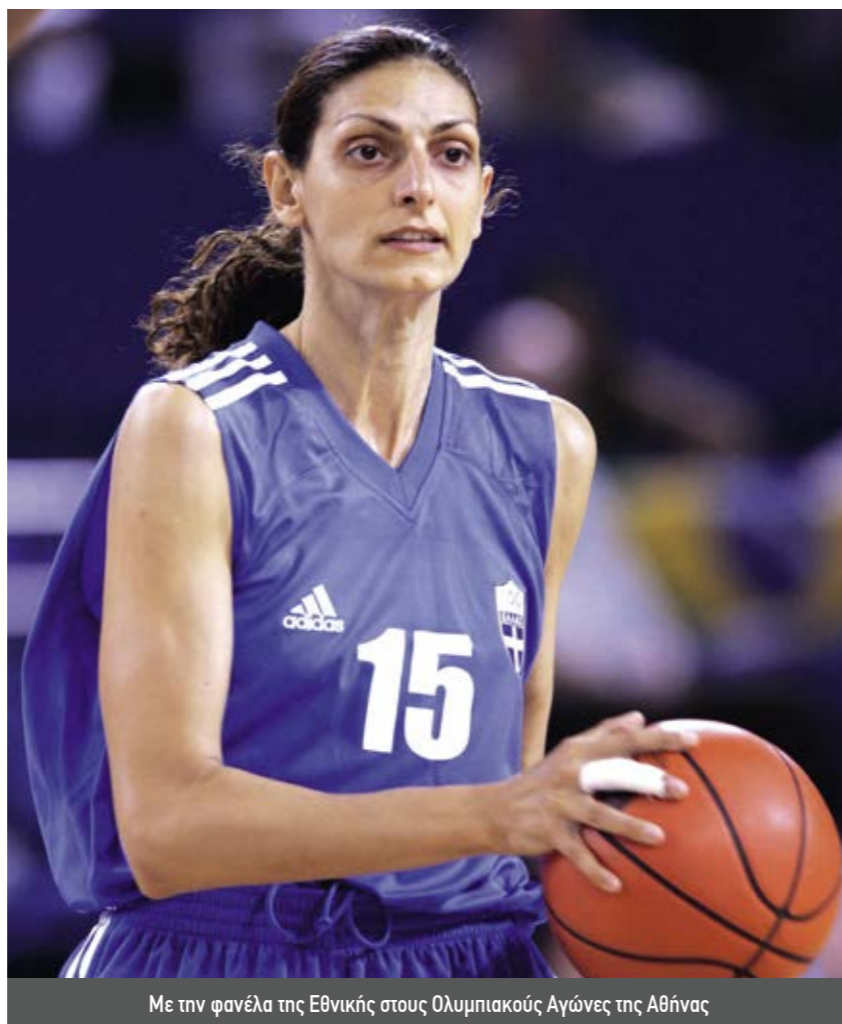
Με την φανέλα της Εθνικής στους Ολυμπιακούς Αγώνες της Αθήνας

Από την προσωπική μου εμπειρία μπορώ να πω ότι αυτό δεν θα συμβεί αποκλειστικά γιατί θα είναι γυναίκα. Οι άνδρες μπασκετμπολίστες είναι